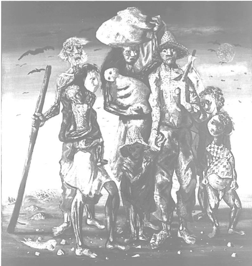
Cândido Portinari – Os retirantes